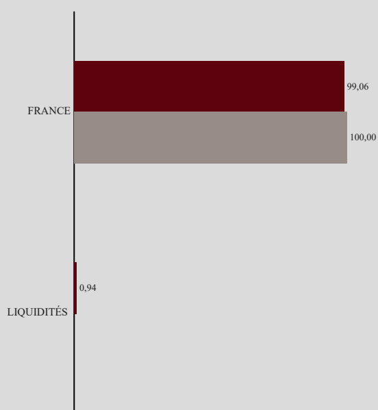
■ PALATINE FRANCE SMALL CAP AU 29.10.2021 ■ INDICATEUR AU 29.10.2021